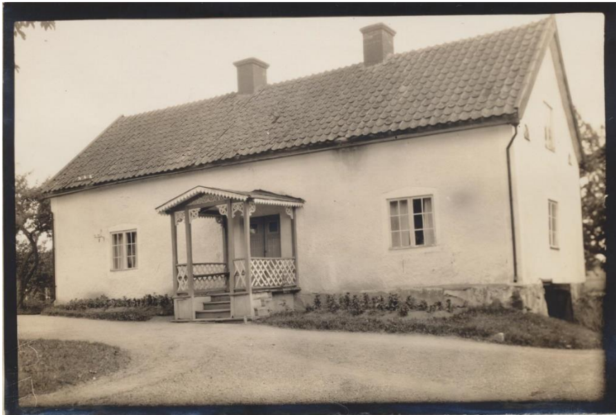
Bränngården vid Edsberga. Foto: Bengt Cnattingius, 1928 Östergötlands Museum

Söder om bygatan låg Bränngården, eller Bostället som den även kallats då det var en gård som var indelad som officersbostad för kronan. Rimligen tillkom gården i och med indelningsverkets tillkomst i slutet av 1600-talet. Att gården genom åren har innehaft av olika militärer visar de olika benämningarna som stället haft; Kaptensbostället, Trumpetaregården, Kornettgården och Löjtnantsbostället. Oftast har gården kallats för Bostället. I mantalslängden 1737 kallas gården Bränngården vilket kan komma av att det förekommit lagstadgad bränneriverksamhet i gården. Namnet Bränngården har länge trots ha härrört från branden 1804. Efter år 1796 beboddes gården inte längre av officerare, utan istället av arrenderande bönder. Gården drabbades i branden 1804 och fick då ny bebyggelse. I samband med laga skifte i Edsberga, vilket påbörjades 1835 och avslutades 1840, flyttades gården 250 meter söderut till sin nuvarande plats. År 1909 ska torpet Hagen, som låg på Bränngårdens mark, ha flyttats till gården för att fungera som undantagsstuga och är den södra flygel. Det gamla bostadshuset revs ca 1950–51 och ersattes med ett nytt hus 1951–52. På 1990-talet styckades gårdsbebyggelsen av och såldes till privat ägare.