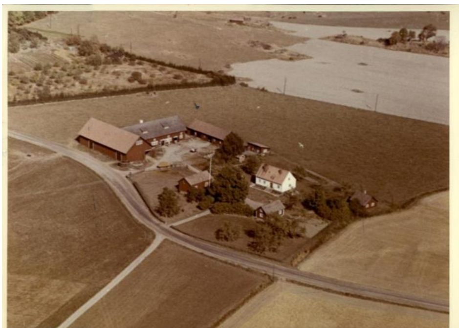
Flygfoto över Edsberga Bränngården taget 1959 av AB Stockholms Aero. Gården flyttades ut från byn till detta läge, strax söder om byn, i och med laga skifte och stod klar 1840.