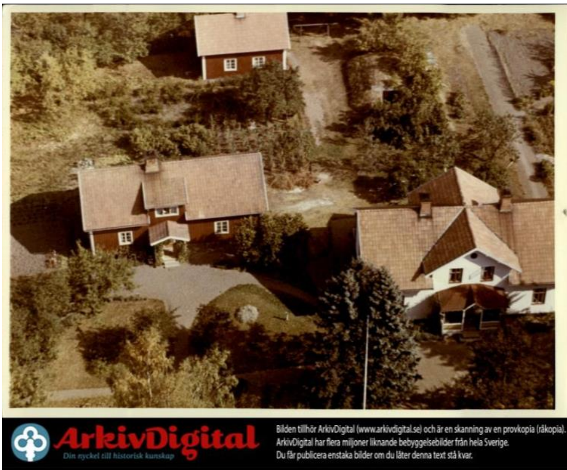
Markusstugan till vänster och Västergårdens huvudbyggnad från 1905 till höger. Den gamla parstugan låg framför de båda byggnaderna.