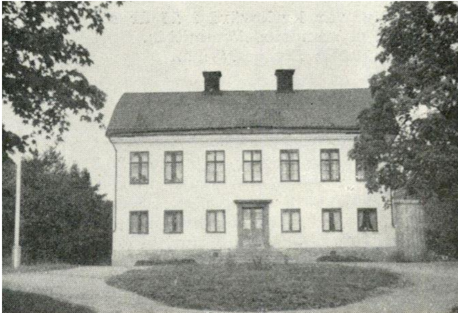
Edsberga gård ur Gods och gårdar 1939.