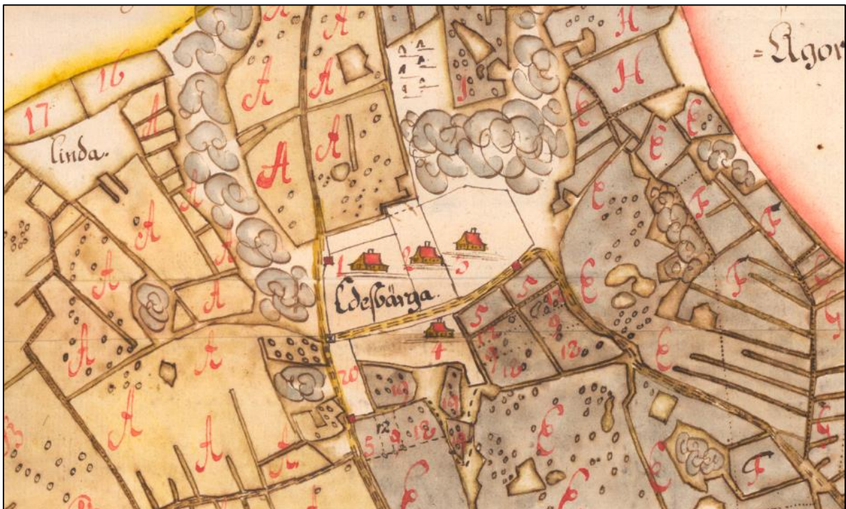
Geometrisk karta över Edsberga 1697 (1) Västergården (2) Mellangården (3) Östergården (4) Löjtnantsbostället.

Gårdarnas nutida adresser är Edsberga Västergården, Edsberga gård och Edsberga Bränngården.