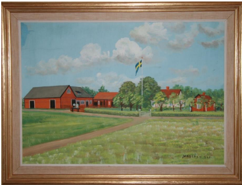
Bränngården vid Edsberga. Målning av Sandgren 1928, Privat ägo